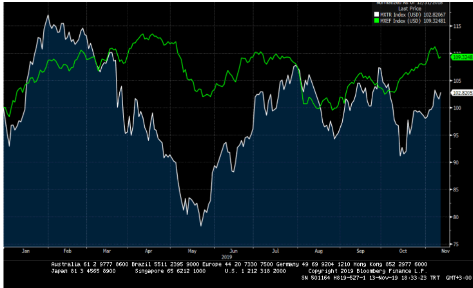
MSCI TR (beyaz seri) vs MSCI GOP