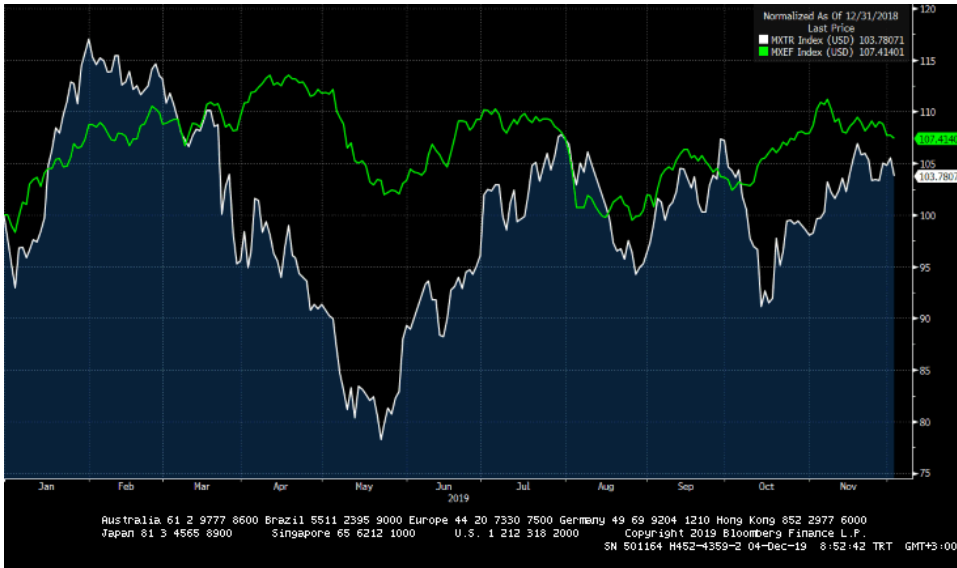
MSCI TR (beyaz seri) vs MSCI GOP