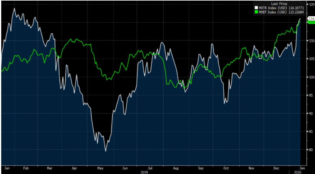
MSCI TR (beyaz seri) vs MSCI GOP