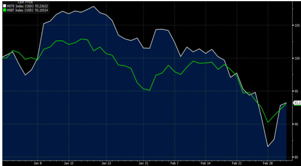
MSCI TR (beyaz seri) vs MSCI GOP- 2020