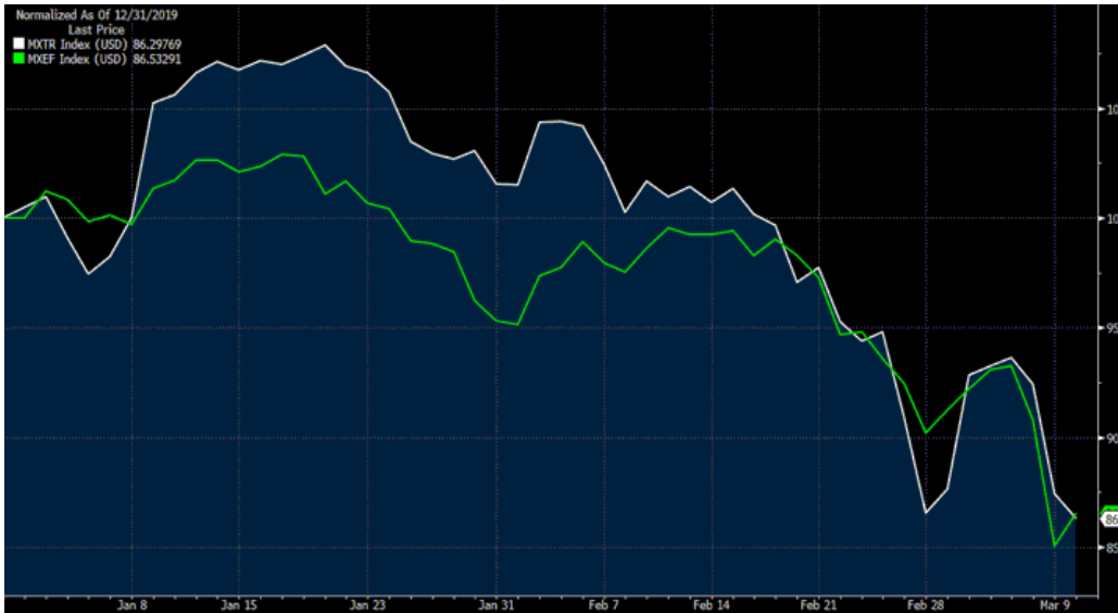
MSCI TR (beyaz seri) vs MSCI GOP- 2020