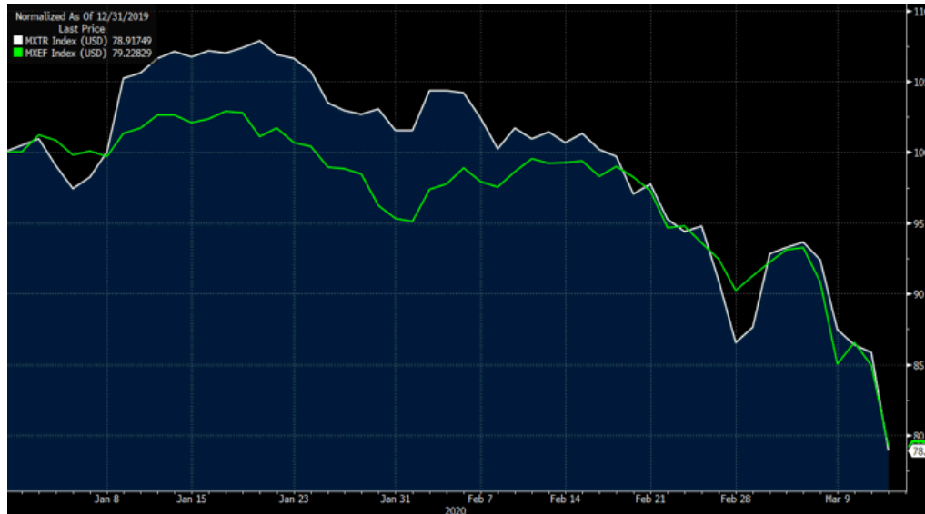
MSCI TR (beyaz seri) vs MSCI GOP- 2020