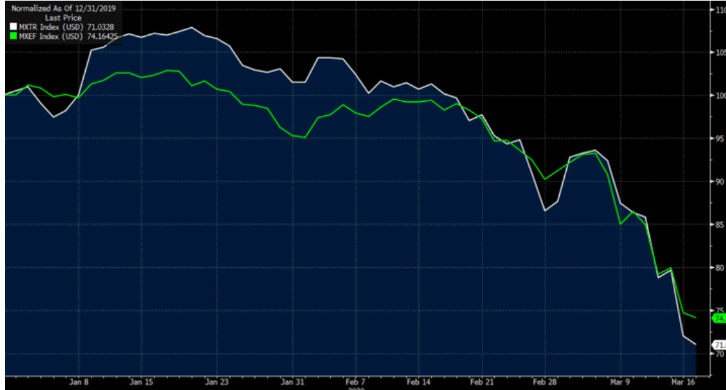
MSCI TR (beyaz seri) vs MSCI GOP- 2020