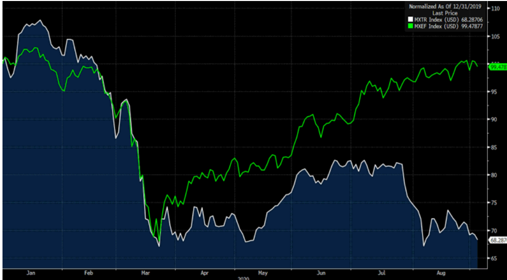
MSCI TR (beyaz seri) ile MSCI GOÜ makası