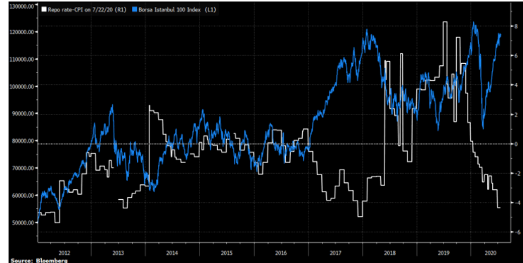
Negatif reel faiz ile BIST-100 arasındaki ilişki...