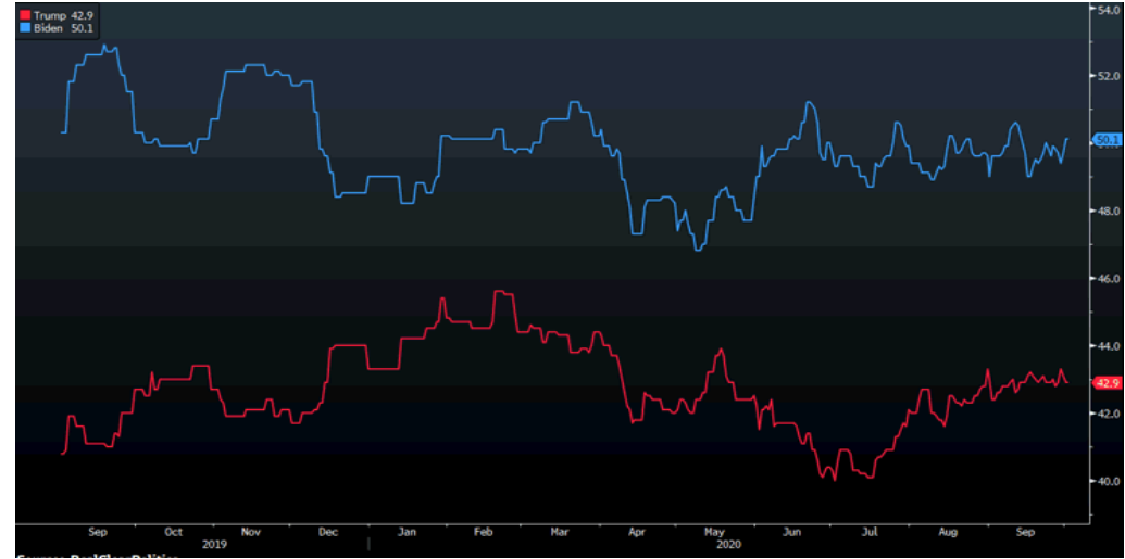
ABD başkanlık seçimi öncesi anketlerdeki Biden önde gidiyor.

BIST-100 endeksinin kısa vadede 1,200 hedefini koruduğunu düşünüyoruz. Endekste 1,150-1,140 destek bölgesi olmak üzere pozisyonlar taşınabilir. Ay sonu başlayacak bilançolar öncesinde sektörel ayrışmalar öne çıkacaktır. 1,140 stop-loss olmak üzere kısa vadeli yimserlik sürecektir.