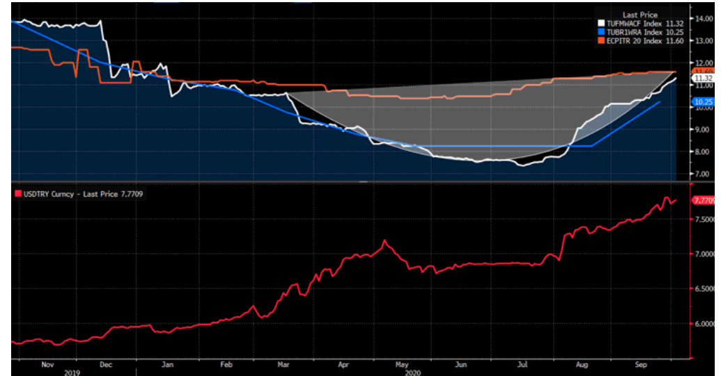
AOFM %11.56 seviyesine yükseldi