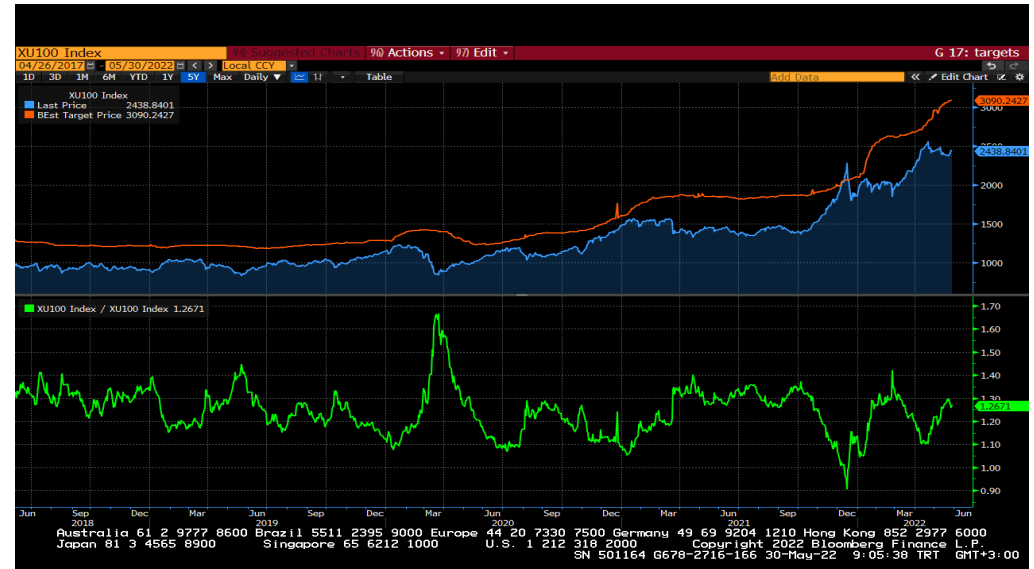
BIST100 endeksi 12 aylık ortalama hedeften %27 uzaklıkta seyrediyor.