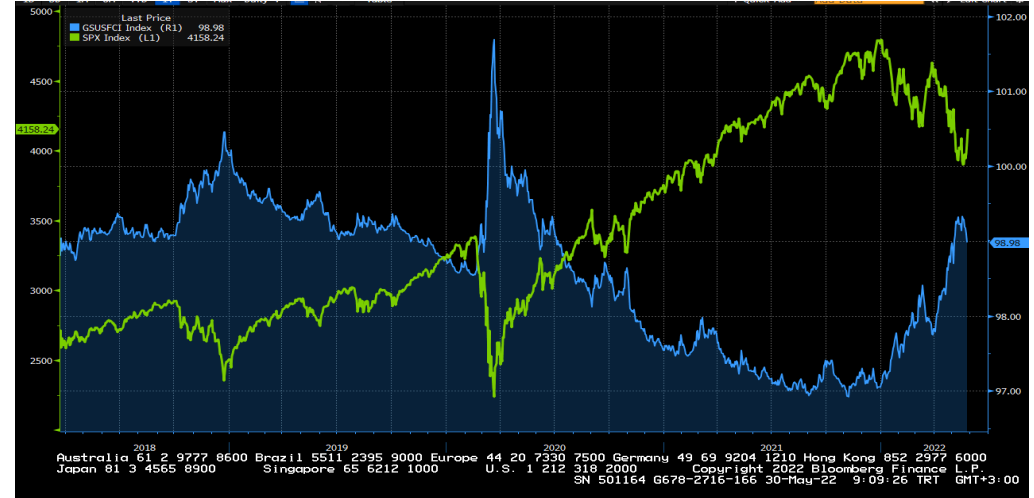
ABD finansal koşullar endeksi (mavi seri) ve S&amp;P500 son 5 yıllık seyri...

BIST100 endeksinin güne pozitif bir başlangıç yapmasını bekliyoruz. Geçen hafta Nisan ayından bu yana devam eden kısa vadeli alçalan kanalı aşmayı başaran endekste 2,475-2,500 dirençleri takip edilebilir, 2,430 ise ilk destek seviyesidir. Endekste teknik görünüm güçleniyor olsa da sektör ve şirket seçimlerinin daha önemli olduğunu düşünüyoruz ve elektrik, perakende, havacılık, madencilik ve rafineri sektörlerini önermeye devam ediyoruz. BIST100, yurtdışındaki güçlü tepki alımlarına, enflasyona endekli yatırım aracı konusundaki belirsizlik sebebiyle, yeteri kadar katılamıyor. Bu nedenle bu konuyla ilgili haber akışı yakından izlenmelidir.