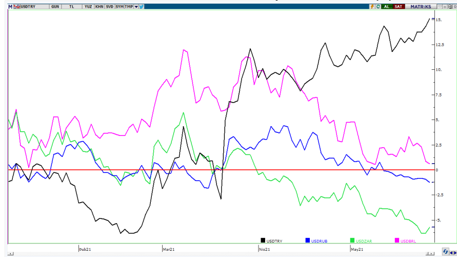
USDTRY—USDRUB—USDZAR—USDBRL 2021 performansları (%)