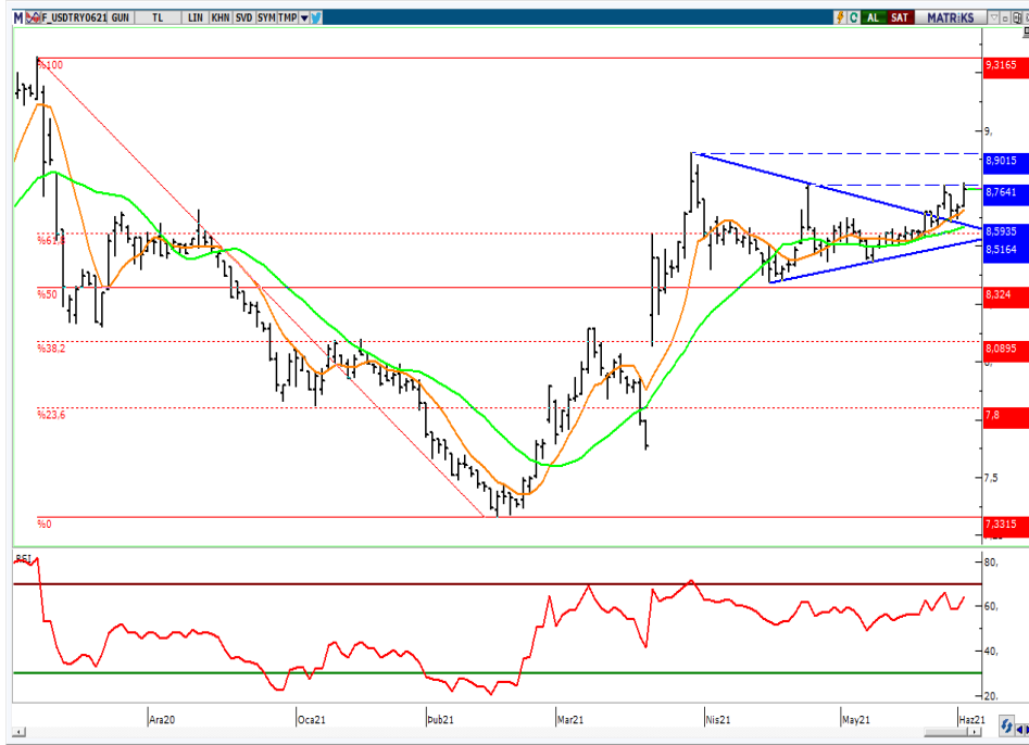
VIOP- Dolar/TL Haziran Vade Kontratı (Günlük)