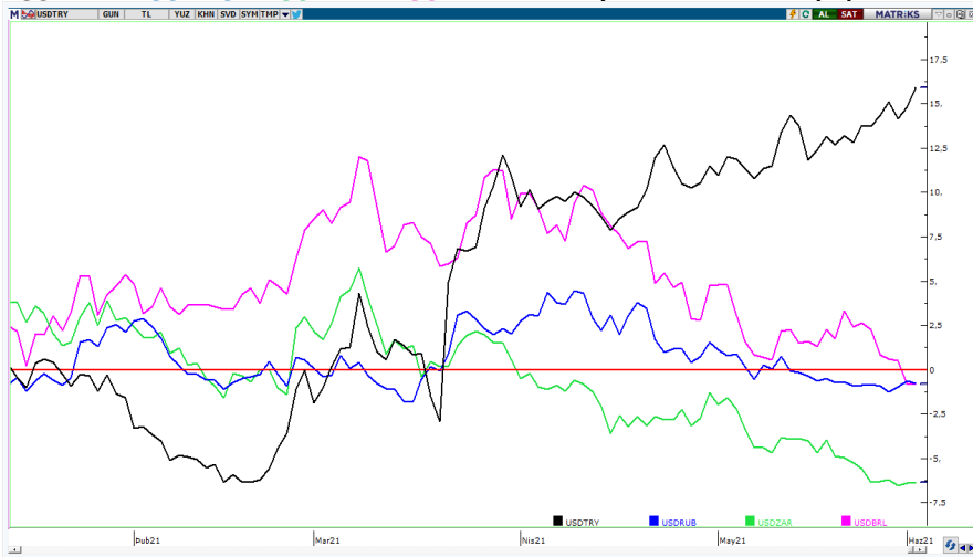
USDTRY—USDRUB—USDZAR—USDBRL 2021 performansları (%)