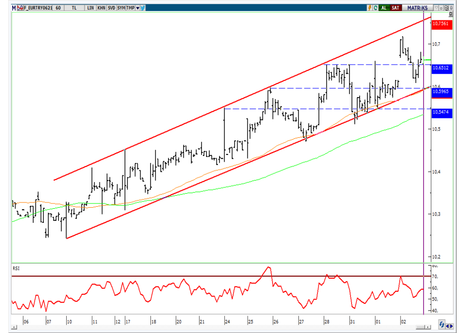
VIOP- Euro/TL Haziran Vade Kontratı (Saatlik)