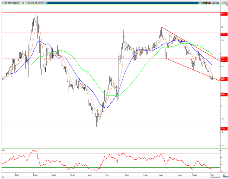
VIOP- Dolar/TL Ekim Vade Kontratı (Günlük)