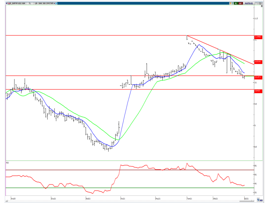
VIOP- Euro/TL Ekim Vade Kontratı (Günlük)