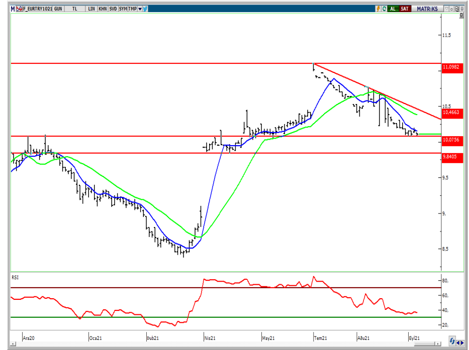
VIOP- Euro/TL Ekim Vade Kontratı (Günlük)