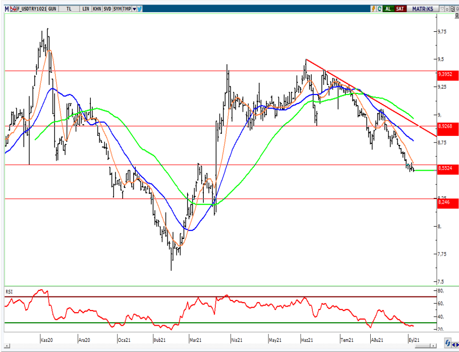
VIOP- Dolar/TL Ekim Vade Kontratı (Günlük)