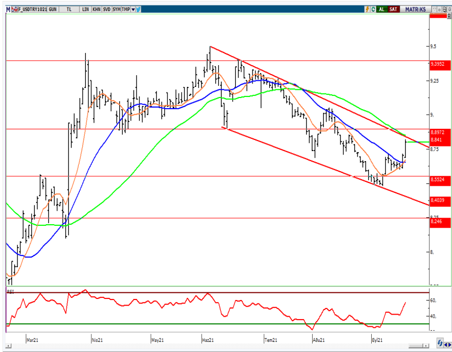
VIOP- Dolar/TL Ekim Vade Kontratı (Günlük)