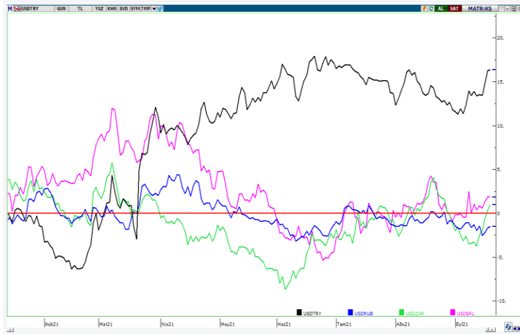
USDTRY—USDRUB—USDZAR—USDBRL 2021 performansları (%)