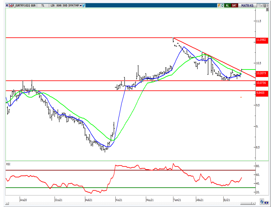
VIOP- Euro/TL Ekim Vade Kontratı (Günlük)