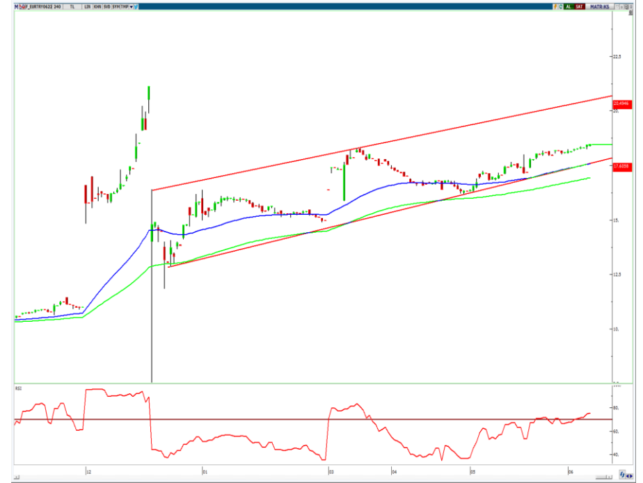
VIOP- Euro/TL Haziran Vade Kontratı (240 dk)