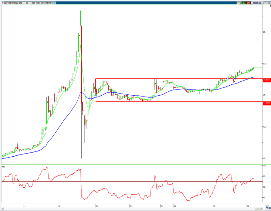
VIOP- Dolar/TL Haziran Vade Kontratı (240 dk)