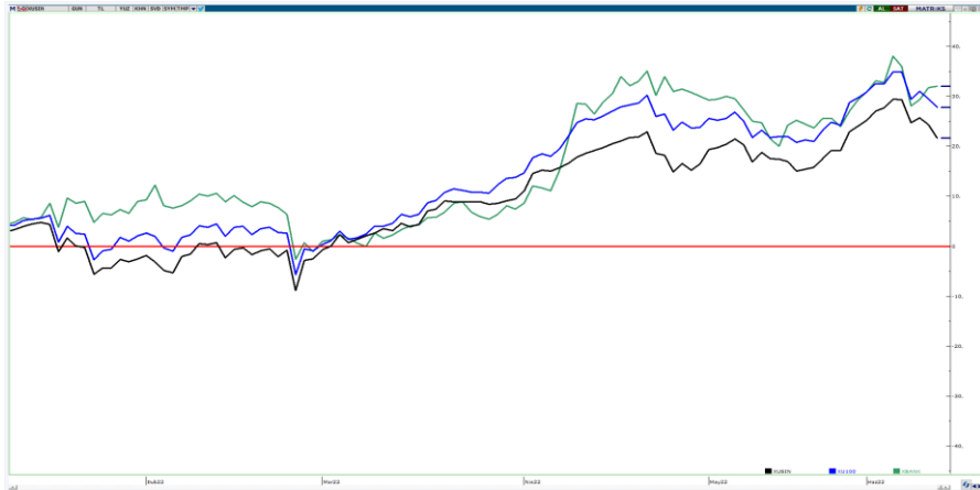
Bankacılık - BIST100 - Sanayi Endeksleri (yıl başından bu yana)