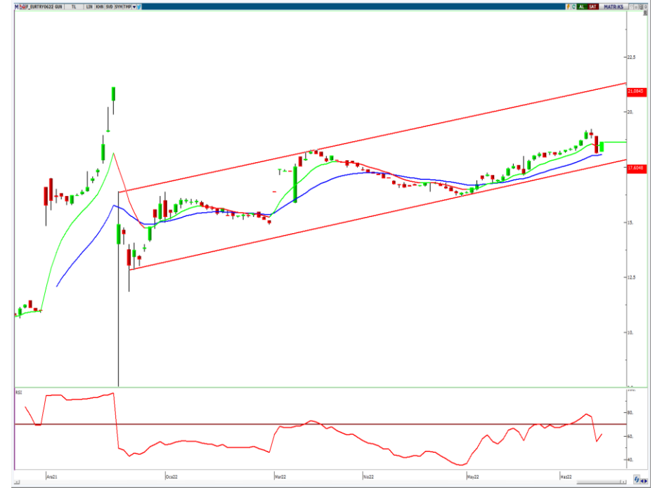
VIOP- Euro/TL Haziran Vade Kontratı (Günlük)