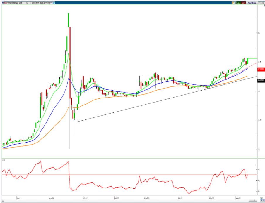
VIOP- Dolar/TL Haziran Vade Kontratı (Günlük)