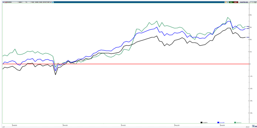
Bankacılık - BIST100 - Sanayi Endeksleri (yıl başından bu yana)