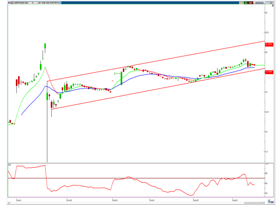
VIOP- Euro/TL Haziran Vade Kontratı (Günlük)