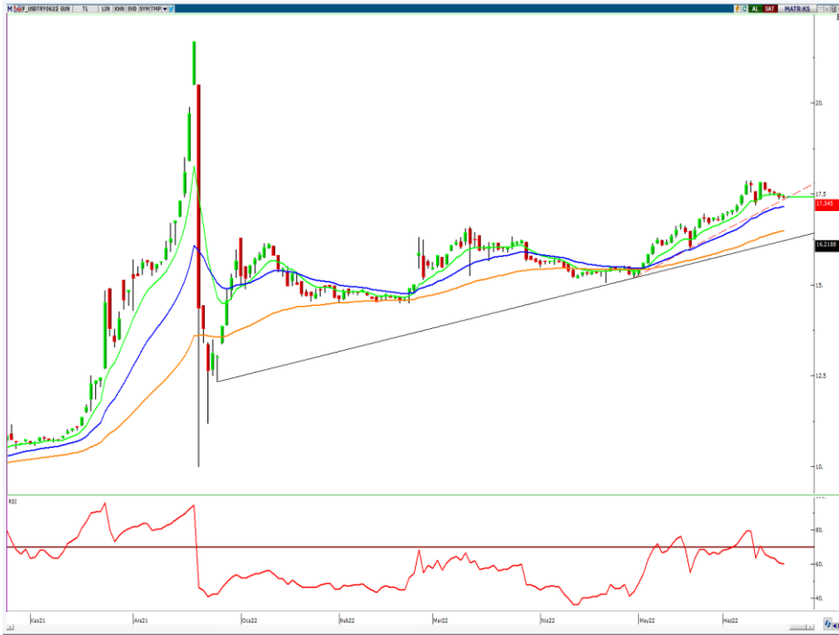
VIOP- Dolar/TL Haziran Vade Kontratı (Günlük)