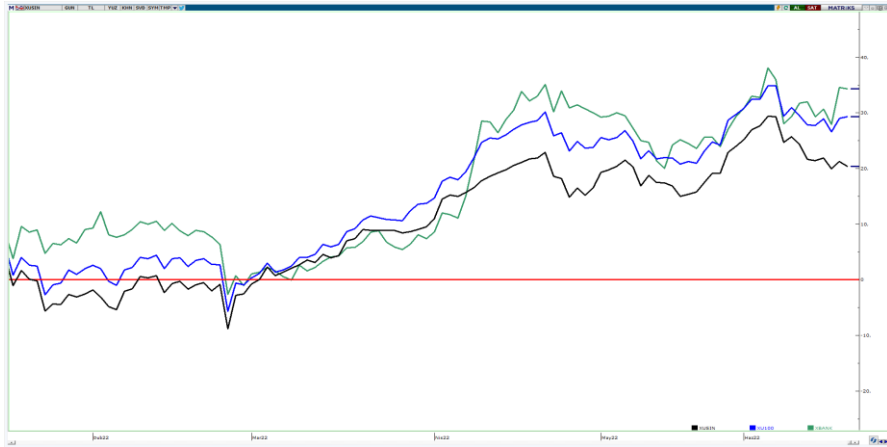
Bankacılık - BIST100 - Sanayi Endeksleri (yıl başından bu yana)