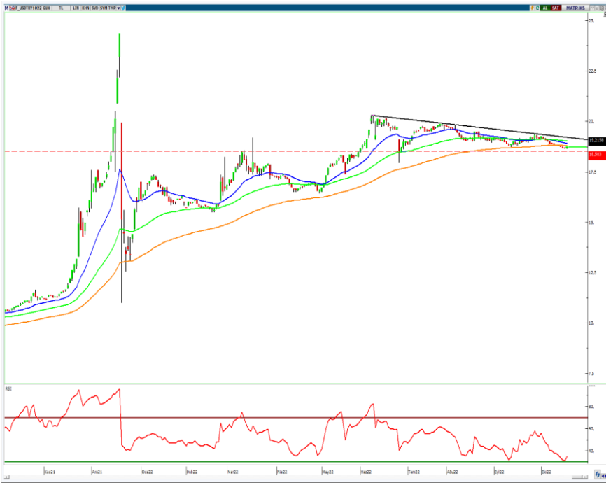
VIOP- Dolar/TL Ekim Vade Kontratı (Günlük)