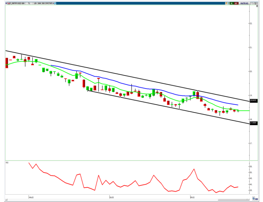
VIOP- Euro/TL Ekim Vade Kontratı (Günlük)