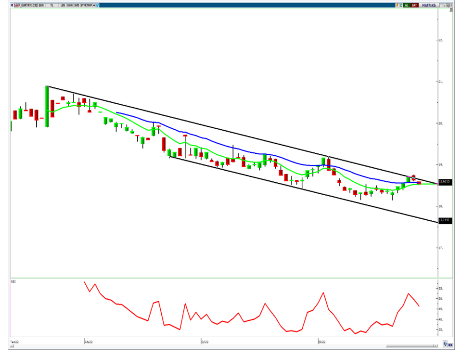
VIOP- Euro/TL Ekim Vade Kontratı (Günlük)