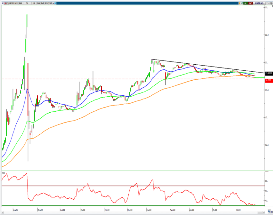
VIOP- Dolar/TL Ekim Vade Kontratı (Günlük)