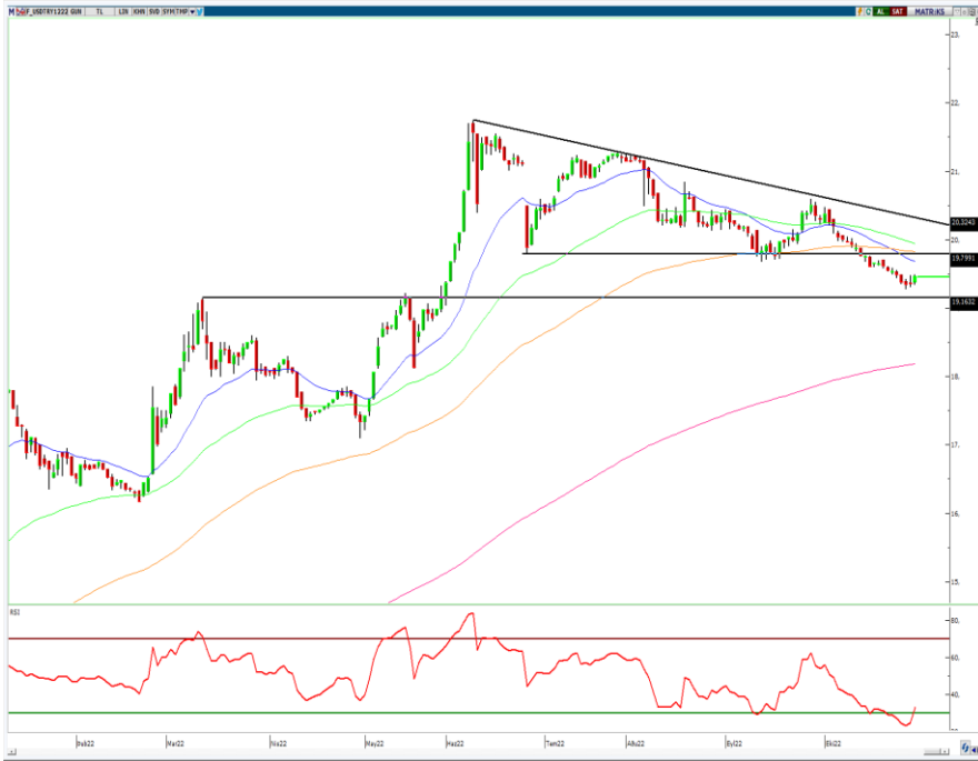
VIOP- Dolar/TL Aralık Vade Kontratı (Günlük)