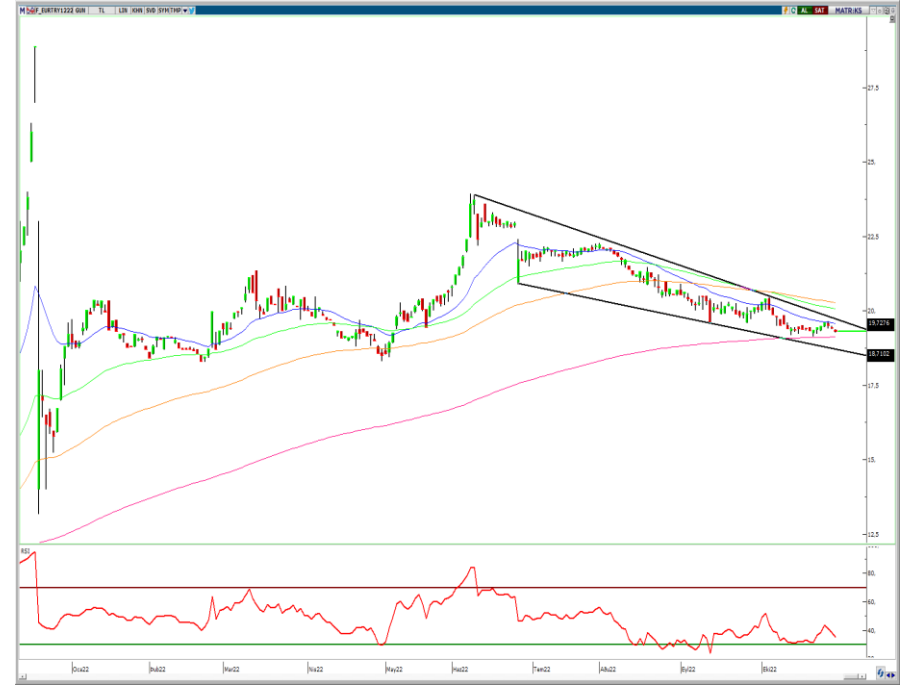
VIOP- Euro/TL Aralık Vade Kontratı (Günlük)