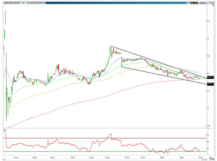
VIOP- Euro/TL Aralık Vade Kontratı (Günlük)