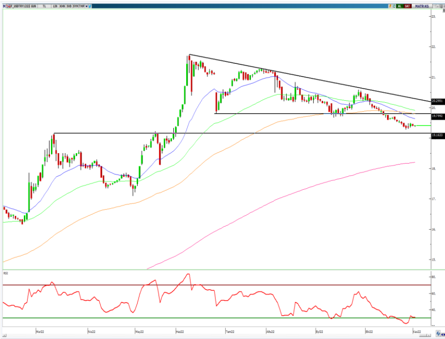
VIOP- Dolar/TL Aralık Vade Kontratı (Günlük)