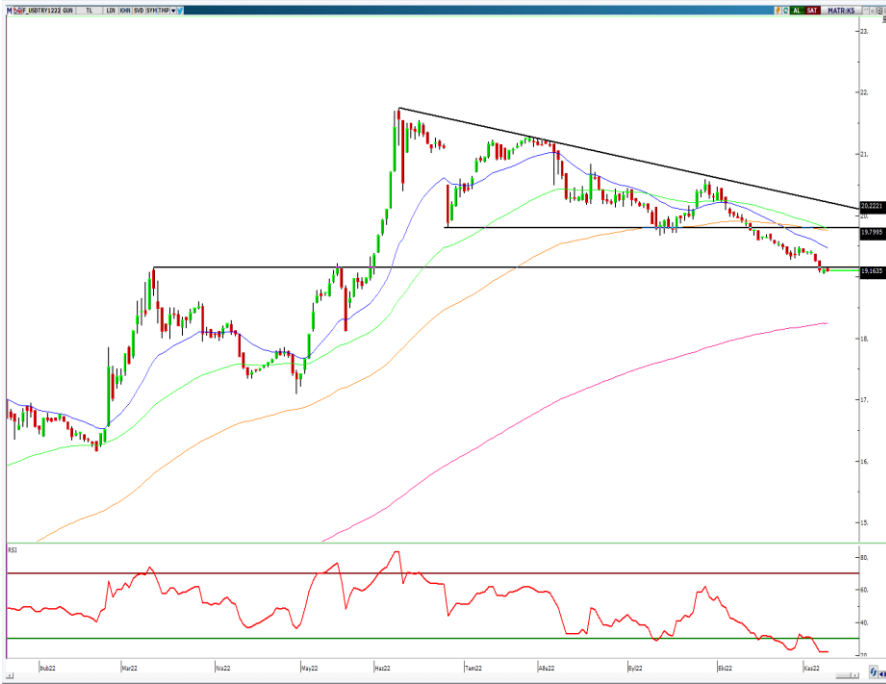
VIOP- Dolar/TL Aralık Vade Kontratı (Günlük)