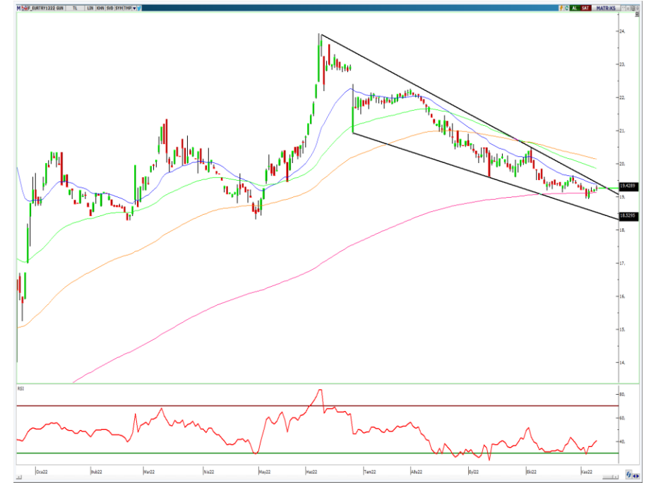
VIOP- Euro/TL Aralık Vade Kontratı (Günlük)