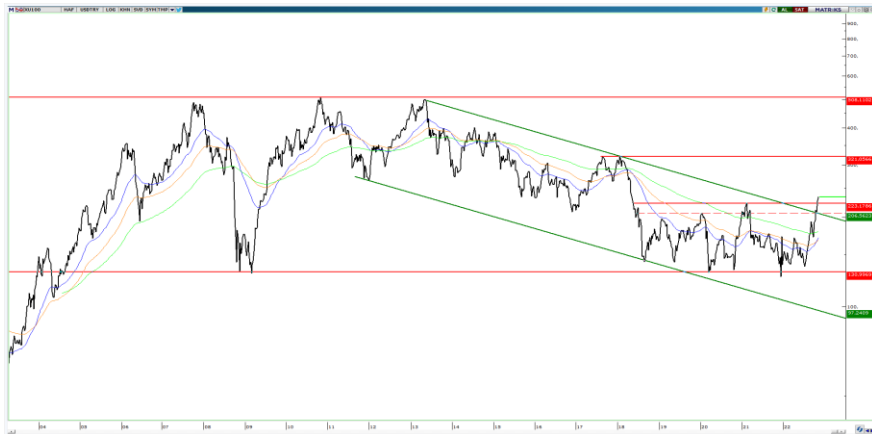
BIST100 ($ bazlı haftalık grafik)