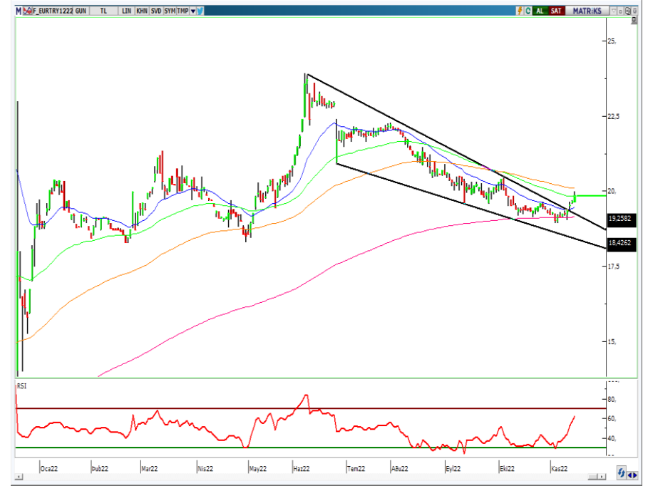
VIOP- Euro/TL Aralık Vade Kontratı (Günlük)