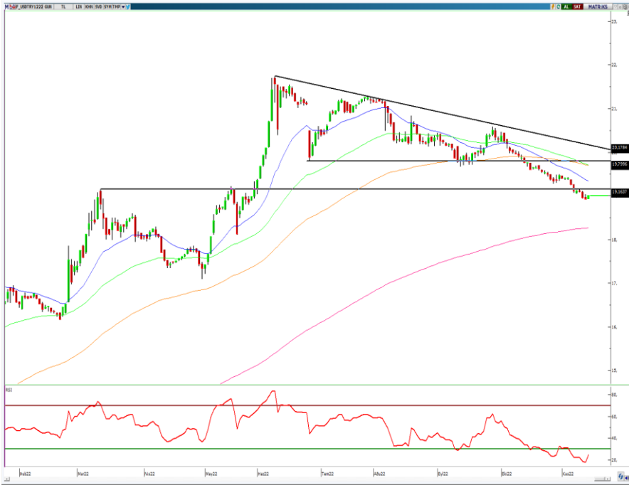
VIOP- Dolar/TL Aralık Vade Kontratı (Günlük)