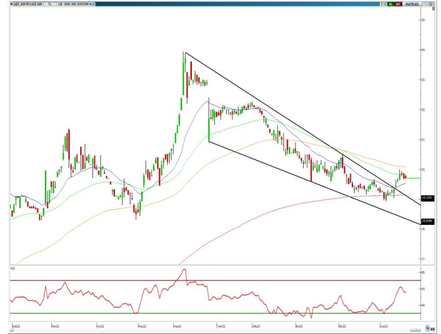
VIOP- Euro/TL Aralık Vade Kontratı (Günlük)