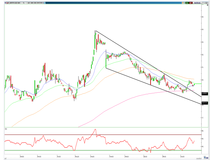
VIOP- Euro/TL Aralık Vade Kontratı (Günlük)