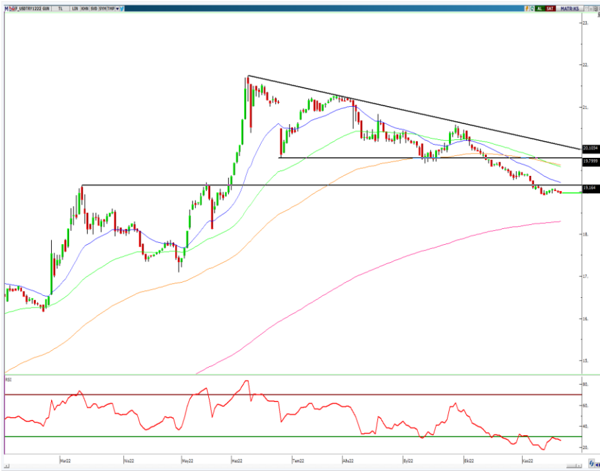
VIOP- Dolar/TL Aralık Vade Kontratı (Günlük)