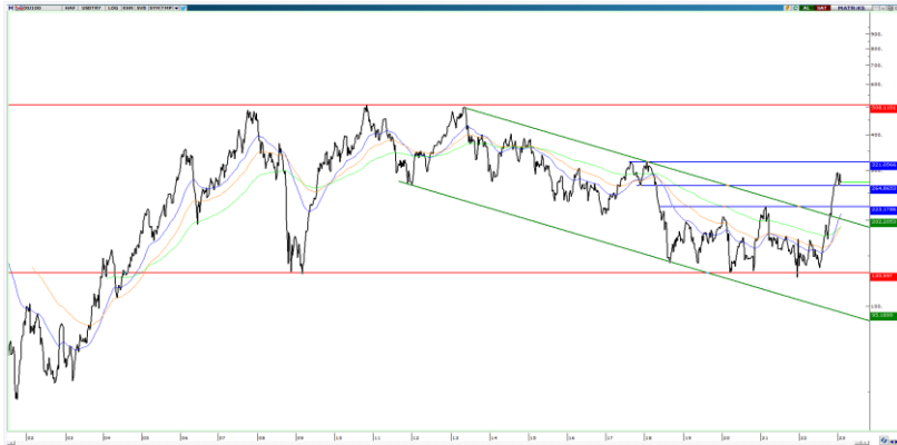
BIST100 ($ bazlı haftalık grafik)