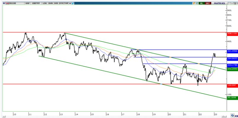
BIST100 ($ bazlı haftalık grafik)