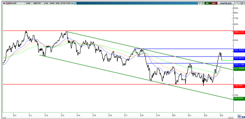
BIST100 ($ bazlı haftalık grafik)